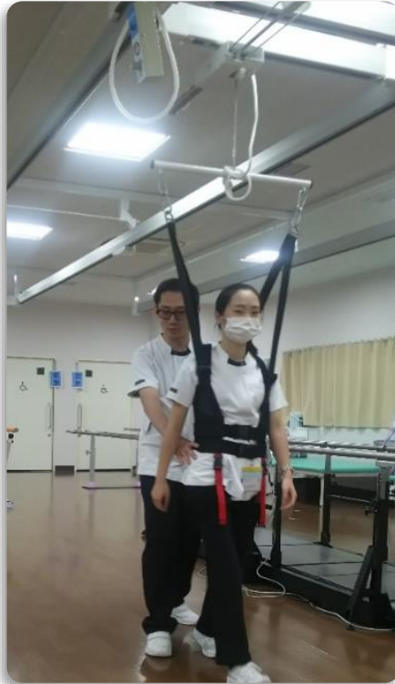
天井設置型免荷装置